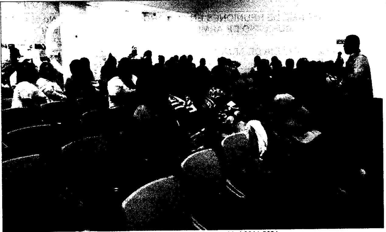
Evaluación de la política de discapacidad 2011-2021

partiendo de la dinámica se recopiló la información adquirida a través de ejercicio lo que permitirá establecer unas líneas de análisis para la evaluación de la política pública de discapacidad; dando por terminado este primer ejercicio se realiza una socialización sobre los resultados de las mesas de la construcción del diagnóstico situacional realizado durante el año 2021 por parte de la Universidad de Quindío y la Alcaldía de Armenia.