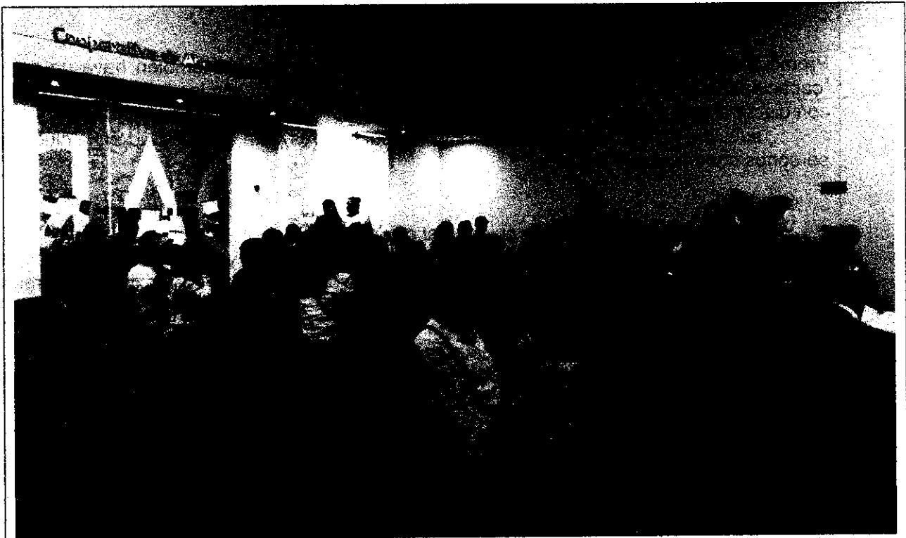
Co-construcción de acciones programáticas para la política pública de discapacidad e inclusión social 2022-2032

Otra de las sugerencias recibidas por parte de la población, dirigida al ejercicio realizado en las mesas y la construcción del plan de acción fueron: