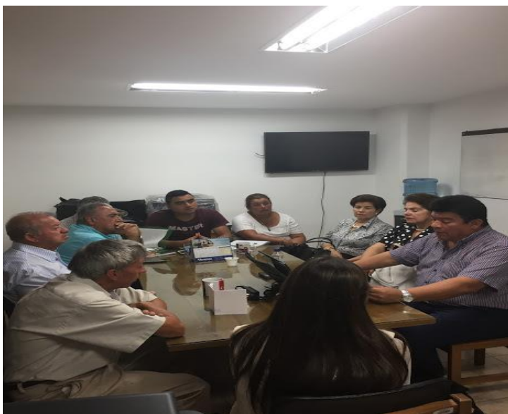
Reunión con líderes de San Juan