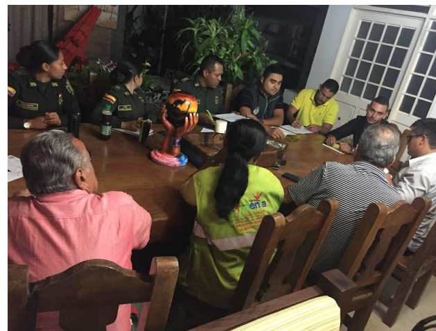
Reunión líderes del barrio Nogal