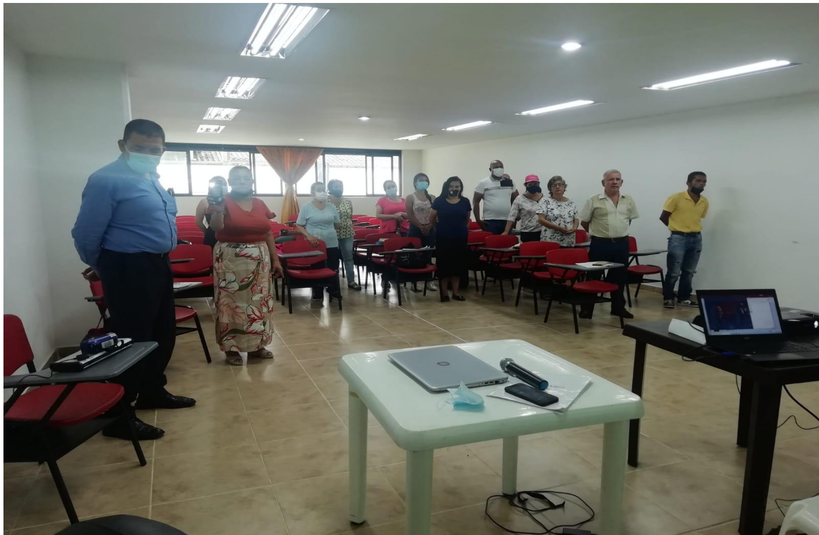
Elaborado por: Erika Bonilla Rios