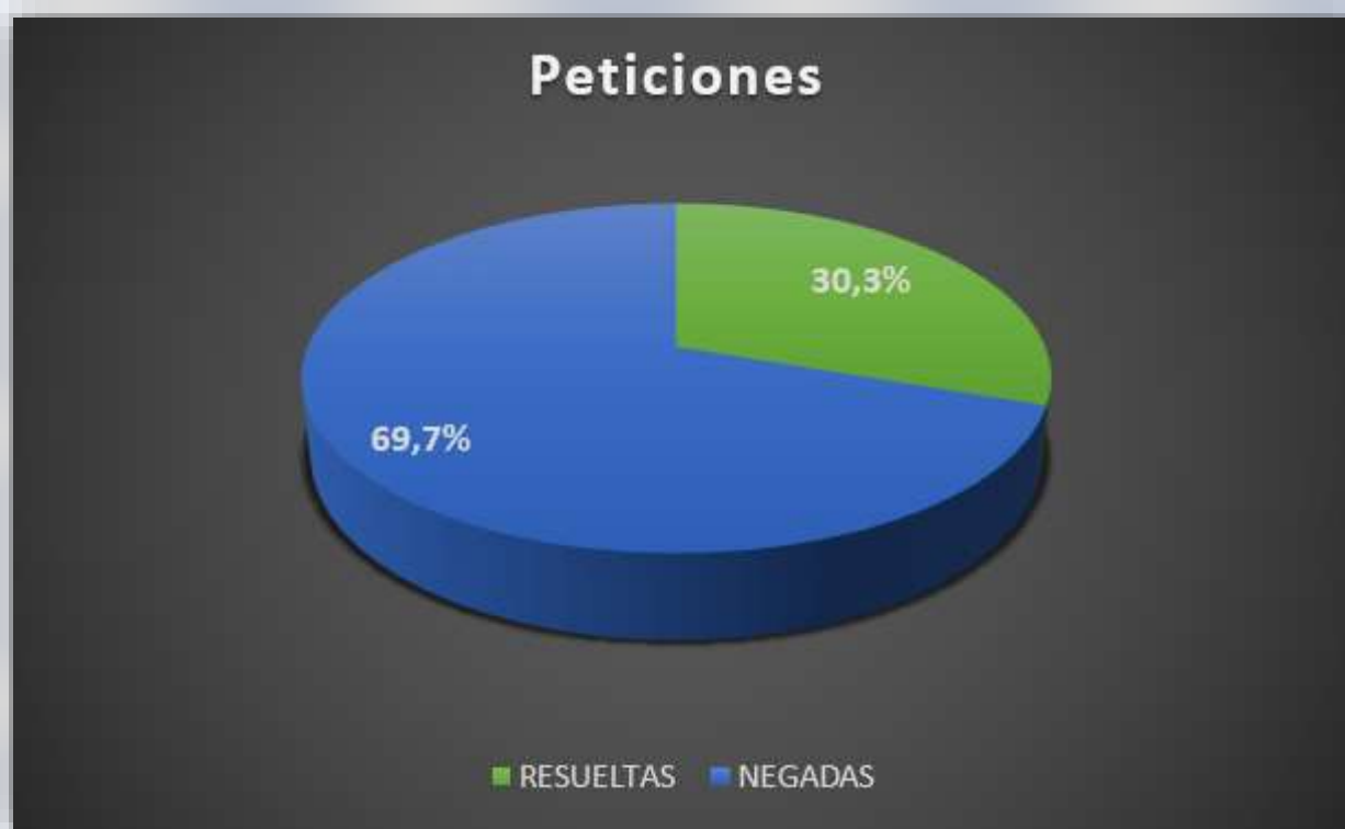
Gráfico 1. Peticiones.

De las 33 peticiones elevadas a la administración municipal y departamental, fueron resueltas 10 equivalente al 30,3%, siendo un balance con resultados desfavorables pese al arduo trabajo de los Ediles a favor del beneficio social comunitario, evidenciándose la falta de voluntad de las entidades municipales y gubernamentales para aportar soluciones a las necesidades sentidas de la población de la comuna 9.