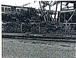
Registro fotográfico del día 18 de diciembre del 2021

NIT: 890000464-3 SECRETARÍA DE HACIENDA Subsecretaría de Catastro